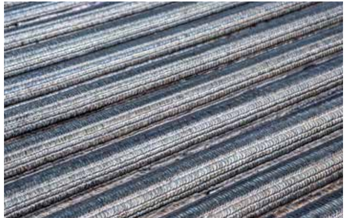
Panneau doté d'un rechargement Unifuse 180

WSI B.V. Marconiweg 16 3225 LV Hellevoetsluis The Netherlands T: +31 88 27 84 539