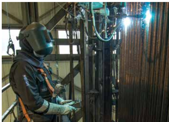
Banc de rechargement

Spécialement mis au point pour répondre à ces problématiques, le rechargement automatique par soudage Unifuse 180 d'WSI offre des performances inégalées dans ce secteur. Sa technologie exceptionnelle repose sur le meilleur talent technique en matière de procédés de soudage, de conception d'équipements, de choix des alliages, de respect des exigences relatives aux codes et les techniques de réduction des contraintes de soudage. Le rechargement automatique par soudage Unifuse 180 surpasse toutes les autres solutions de revêtement.