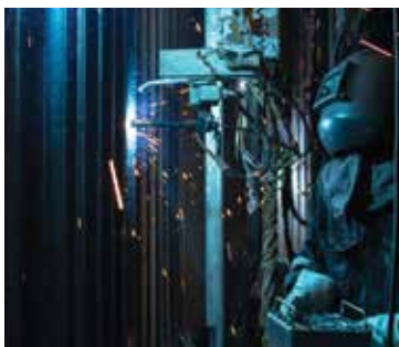
Réparation en usine d'incinération

La prestation de services in-situ constitue le principal segment commercial d'WSI. Aucune autre entreprise n'est en mesure d'offrir le soutien logistique, les équipements et les ressources en personnel nécessaires pour remettre en état de très grandes surfaces dans un délai restreint. Ce processus est généralement moins coûteux que le remplacement des panneaux, ce qui constitue un avantage économique clé pour les clients.